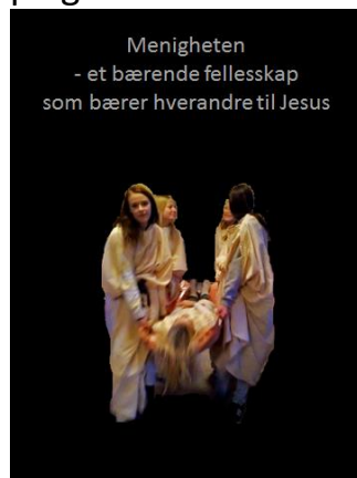
Menigheten - et bærende fellesskap som bærer hverandre til Jesus

Det er alltid en vei tilbake. Den veien går gjennom at vi angrer det gale vi gjør og så ber vi våre medmennesker om tilgivelse. Dernest ber vi Gud om tilgivelse. I Bibelen kalles det omvendelse – å vende om. Vi snur oss da vekk fra det onde og går i motsatt retning, den veien som Jesus vil vi skal gå. Da gir Gud sin nåde på grunn av Jesus. Det er alltid nåde å få for syndere som vender om. (Bilde 33)